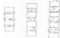
Erholung für Ihre Bandscheiben

Darum habe ich, neben meinen sonstigen Lieblingsbewegungsformen, eine 4-jährigen Ausbildung zum Bewegungspädagogen nach der Franklin-Methode absolviert. Das Wissen, wie Knochen, Muskeln, Faszien und auch Organe zusammenspielen, wie letztlich Bewegung funktioniert, hilft mir in ganz vielen Bereichen - eben immer dann, wenn ich mich bewege.