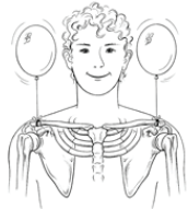
Entspannte Schultern, gelöster Nacken